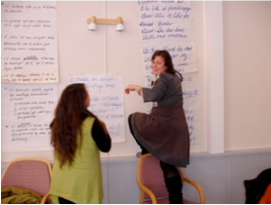
"Lek med ord på fagutdannelsen i livsveiledning"